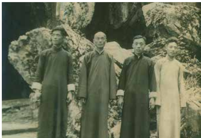
民國年代的宋家是上海略有名聲的裁縫家庭。