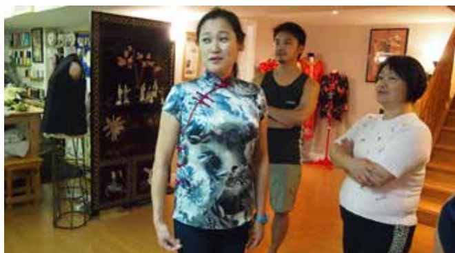
Simon因目睹父母的手藝深受感動，產生學師念頭。