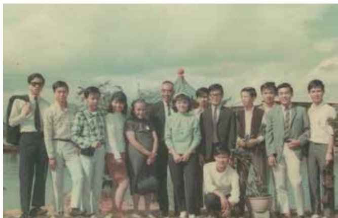
六十年代的淺水灣裁縫學徒。